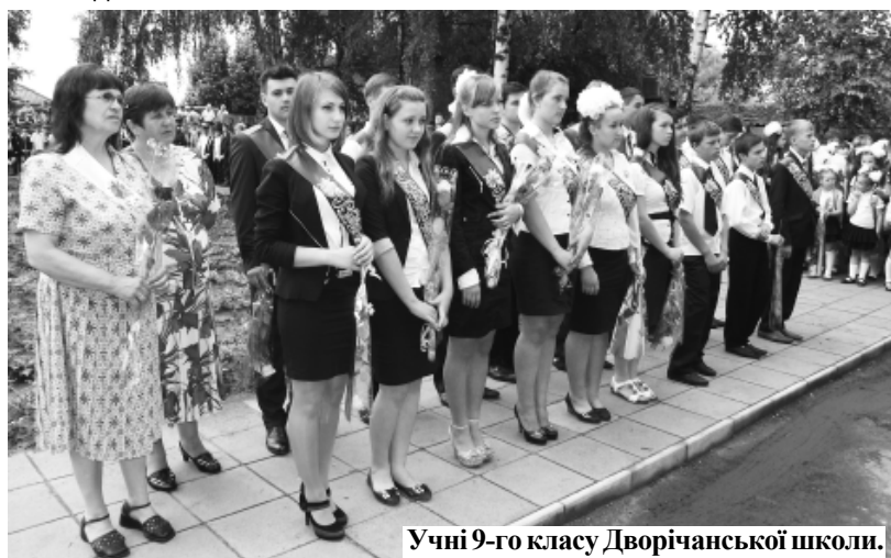
Учні 9-го класу Дворічанської школи.