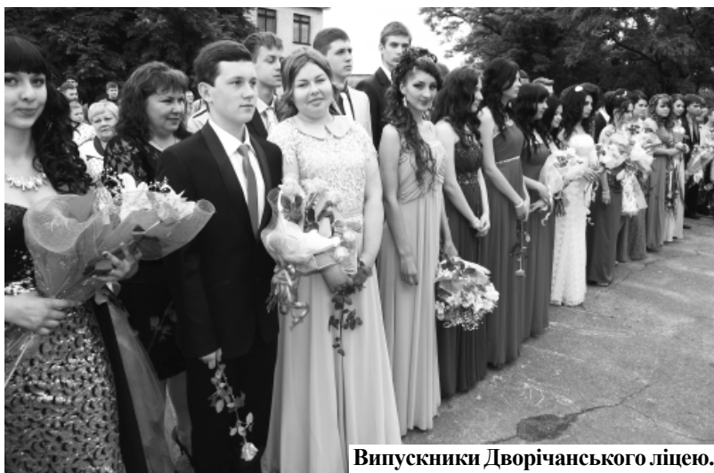
Випускники Дворічанського ліцею.

добре відпочити на літніх канікулах, а випускникам – відсвяткувати випускний вечір і на «відмінно» скласти ЗНО. Урочиста лінійка завершилася гімном ліцею та зворушливою мелодією дзвоника, яка востаннє пролунала для випускників.