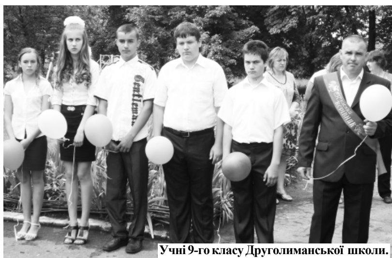
Учні 9-го класу Друголиманської школи.