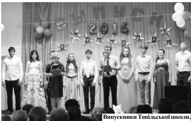
Випускники Топільської школи.