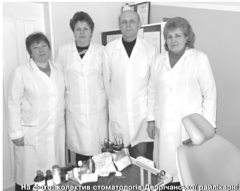
На фото: колектив стоматологів Дворічанської райлікарні.

С.В. – У нашому стоматологічному відділенні відсутній рентге-