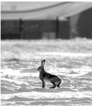
По материалам: Сегодня.ua

В аэропорту «Киев» (Жуляны) поселилось семейство... зайцев. Одного из них сотрудники аэропорта прозвали Смелчаком-Виталиком, поскольку он периодически подходит ко взлетно-посадочной полосе и, встав на задние лапки, встречает прилетающие самолеты. Зверька запечатлел фотограф Виталий Несенюк в конце января - именно в его честь заяц и получил такое прозвище. «Зверек живет на территории нашего аэродрома постоянно и наблюдает за самолетами. Виталик питается морковью, поставляемой в аэропорт. Это наш подшефный заяц! Настоящий любитель авиации, несмотря на морозы и шум самолетов», - говорят в пресс-службе аэропорта. «Зайцев на территории аэропорта много. Куча следов на снегу! А этот стоял в 20-градусный мороз и внимательно рассматривал самолеты. Я видел его тут несколько раз, но в тот день не смог удержаться, чтобы не сфотографировать», - рассказывает Виталий.