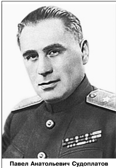
Павел Анатольевич Судоплатов