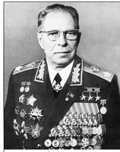
Дмитрий Федорович Устинов