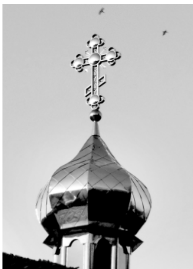
Честного и Животворящего Креста Твоего и сохрани нас от всякого зла. Аминь.