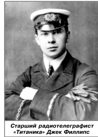
Старший радиотелеграфист «Титаника» Джек Филлипс

прекратила свою работу служба контроля за сигналами бедствия морских судов на частоте 500 килогерц (Global Maritime Distress Safety System). В газете «Известия» от 2-го февраля 1999 года писалось: «С 1 февраля потерпевшие кораблекрушение уже не могут посылать в эфир позывные SOS. По решению международной морской организации этот сигнал упразднен. Его заменила автоматизированная система оповещения о бедствиях, замкнутая в глобальную сеть спутников «Inmarsat». Практикам нововведение пришлось по душе. Система спутникового слежения надежнее и прицельнее: местонахождение попавшего в беду судна определяется мгновенно, и при том с точностью плюс-минус 200 метров. Затем информация передается в четыре центра чрезвычайной помощи на море,