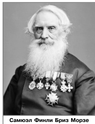
Самюэл Финли Бриз Морзе

Увиденный опыт натолкнул его на мысль о создании системы передачи сигналов по проводам. После пяти лет экспериментов ему удалось это сделать. Для передачи сигнала использовался ключ, изобретенный российским ученым Б.С. Якоби, а для приема – электромагнит, якорь которого управлял перемещением по бумаге чернильного пера.