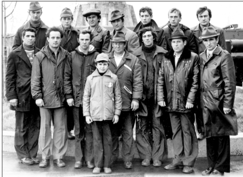
Осінь 1981 року, м. Київ – перший виїзд сільської футбольної команди «Маяк» (Тавільжанка) до столиці України на матч команд майстрів чемпіонату СРСР «Динамо» (Київ) – «Зеніт» (Ленінград) – 3:1.

Матч очікувався з великим інтересом. Глядачів зібралось – не порахувати. Аж нарешті головний суддя матчу В.Ф. Гарькавий запросив команди на поле. Колективи підійшли до гри в оптимальних кондиціях і виставили свої найсильніші склади. Перевага тавільжанців у майстерності знайшла відбиток у рахунок першого тайму, коли «Маяк» мав перевагу з рахунком 2:0. Після перерви господарі скоротили відставання, але в