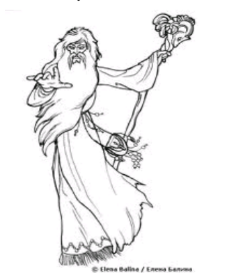
© Elena Balina / Emma Satorra

Звісно, велика кількість персонажів наших казок, переказів і легенд веде свій відлік ще з часів язичництва. Просто з роками вони втратили своє первісне значення і перетворилися на художньо-поетичні образи усної народної творчості. Це і русалка, і водяник, і домовик, і ще багато різних істот, що існували колись в уяві наших далеких