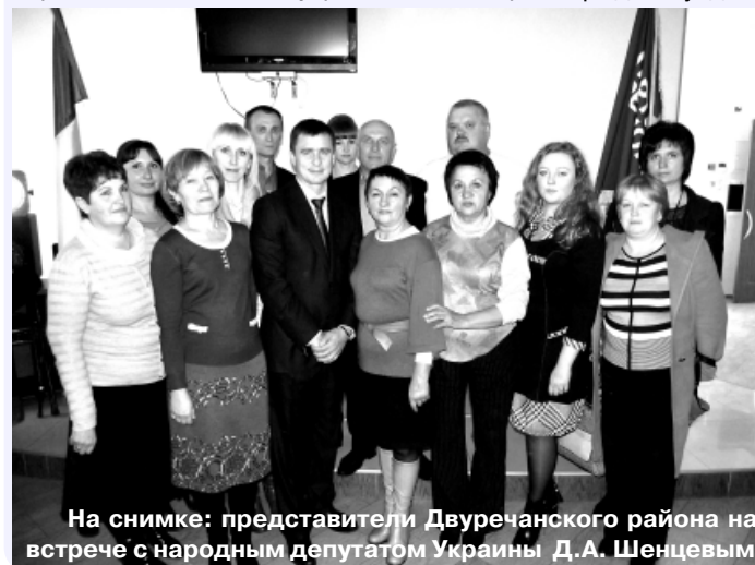
На снимке: представители Двуречанского района на встрече с народным депутатом Украины Д.А. Шенцевым

От имени каждого из районов округа со словами искренней благодарности к народному депутату Украины обратились